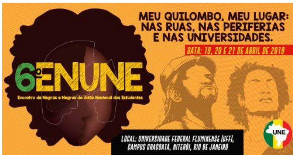
Figura 8 – Cartaz VI ENUNE