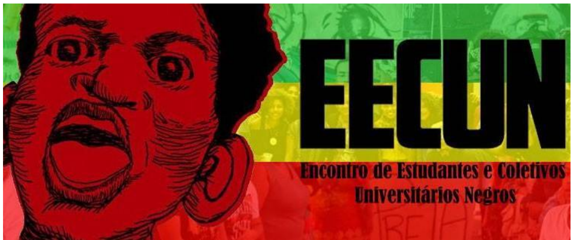
Figura 5 - Cartaz do EECUN