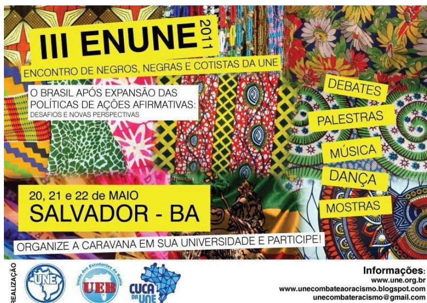
Figura 3 – Cartaz III ENUNE: