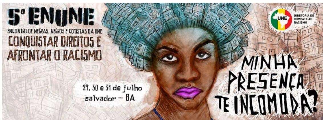
Figura 7 – Cartaz V ENUNE