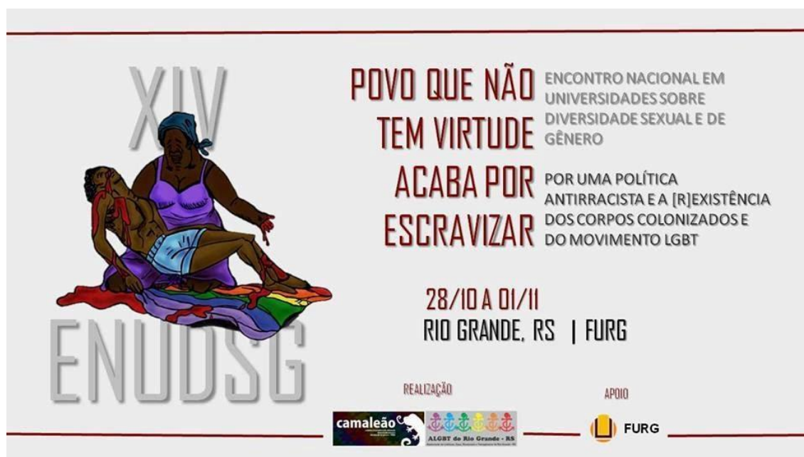
Figura 9 – Cartaz XIV ENUDS