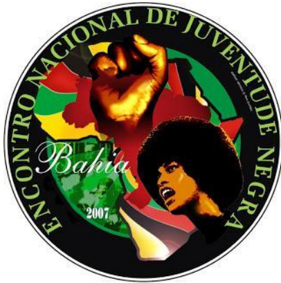
Figura 1 – Cartaz ENJUNE: