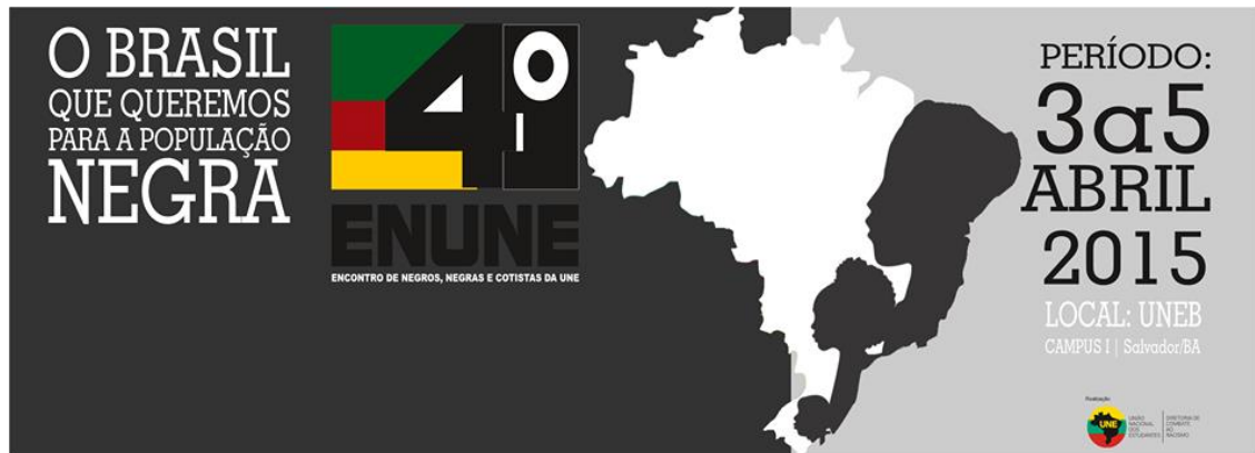
Figura 6 – Cartaz IV ENUNE