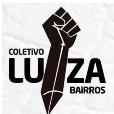
Figura 10: Cartaz Coletivo Luiza Bairros