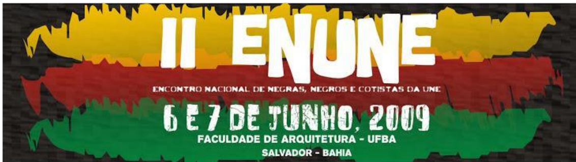
Figura 2 – Cartaz II ENUNE: