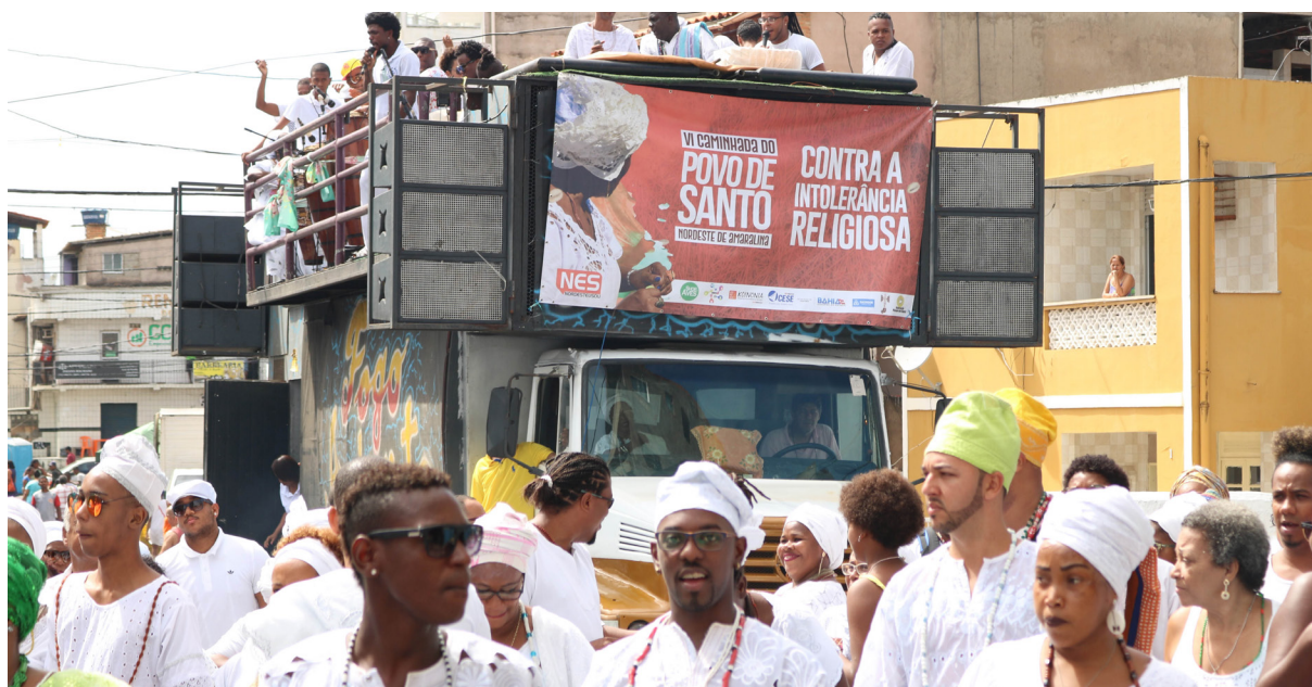
VI Caminhada do Povo de Santo do Nordeste de Amaralina, Salvador (BA), 2018.