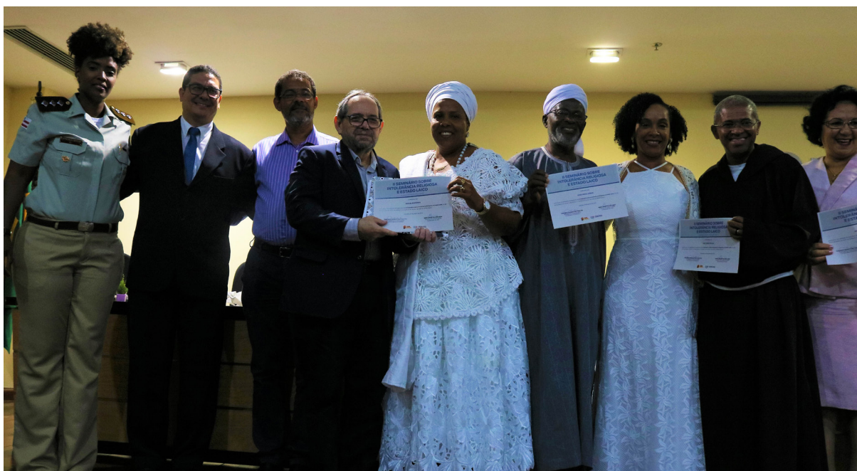
II Seminário sobre Intolerância Religiosa e Estado Laico, Salvador (BA), 2018.

instauração de processos e procedimentos tiveram um aumento de 300% desde 2015. Apesar das limitações estruturais do MP, com uma equipe pequena para atender a quantidade de grupos vulnerabilizados, entretanto, tem sido um dos serviços públicos que o povo de santo tem sentido possibilidade de apoio.