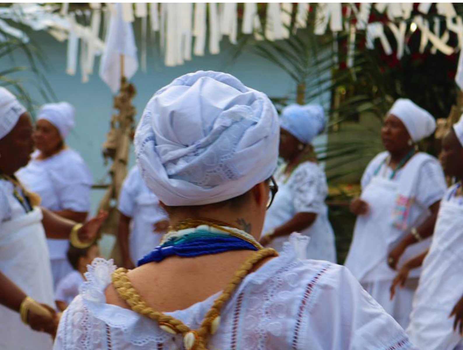
Olubajé, 2018, Salvador (BA)