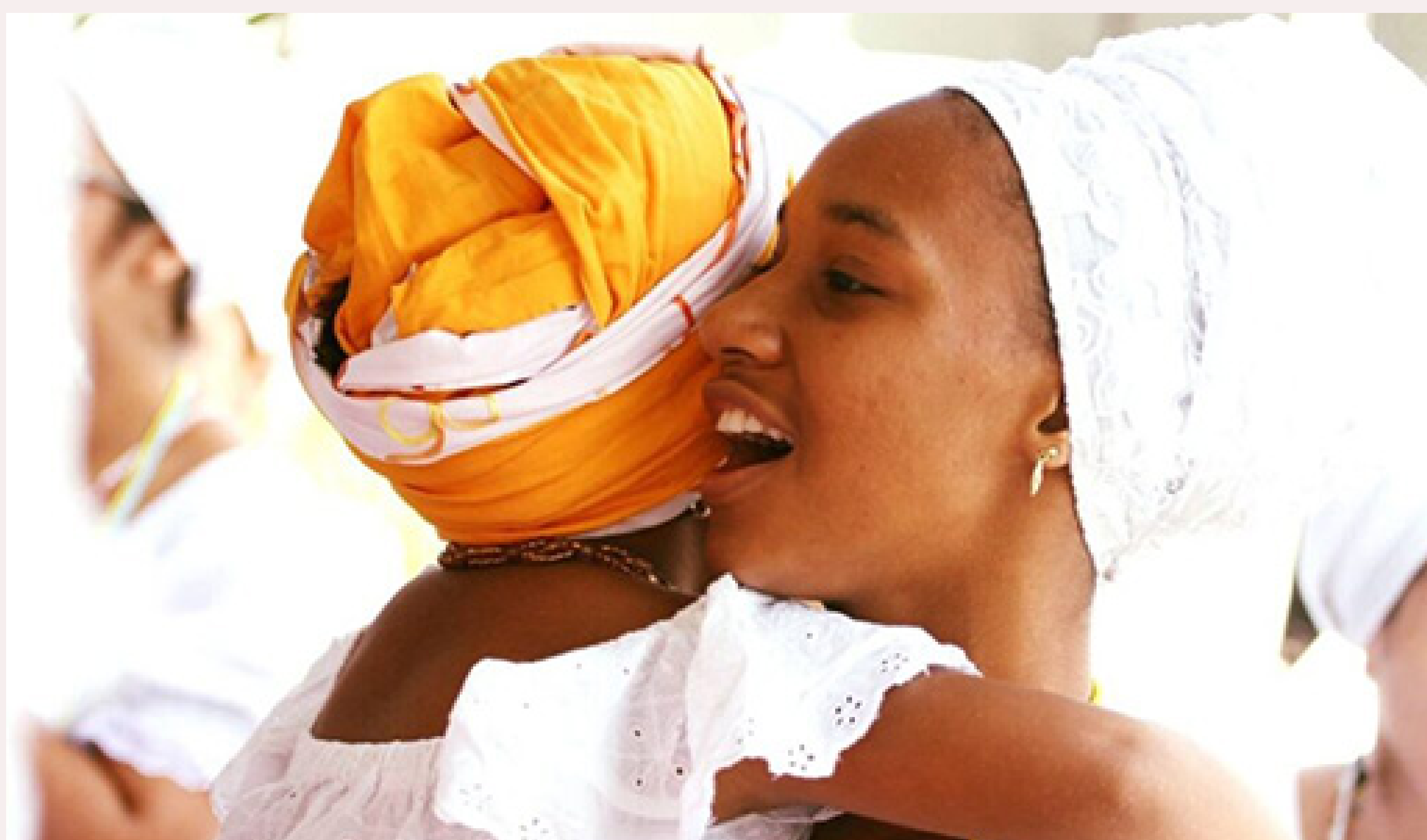
Imagem: Imagem Encontro Nacional de Crianças de Axé

Se por um lado a dimensão coercitiva do Direito precise ser mencionada e defendida, a sociedade civil e as organizações em defesa dos direitos humanos devem fortalecer a dimensão preventiva como instrumento de política pública. Afinal, o papel do Estado deve ser também o de garantir a coexistência, o respeito recíproco e a convivência harmoniosa. A Lei de Ação Civil Pública, de 2014, por exemplo, passou a ter no rol do patrimônio social brasileiro a honra e a dignidade dos grupos religiosos. A Lei de Diretrizes e Bases da Educação possui dois princípios de tolerância em práticas educacionais, mas não há regulamentação disso a nível estadual e municipal. Não obstante, é possível pensar o novo espaço que o Código de Processo Civil abriu em 2015 pela disputa da interpretação do direito, criando a possibilidade de discutir, por exemplo, o ensino jurídico, o qual não pode ser descolado da formação da cidadania. Pensando no fato de que o “Curanderismo” ainda está no artigo 284 do Código Penal e, que a punição por curandeirismo no Brasil recai sobre a macumba, destaca-se que é preciso preparar os terreiros para mover ações coletivas aproveitan-